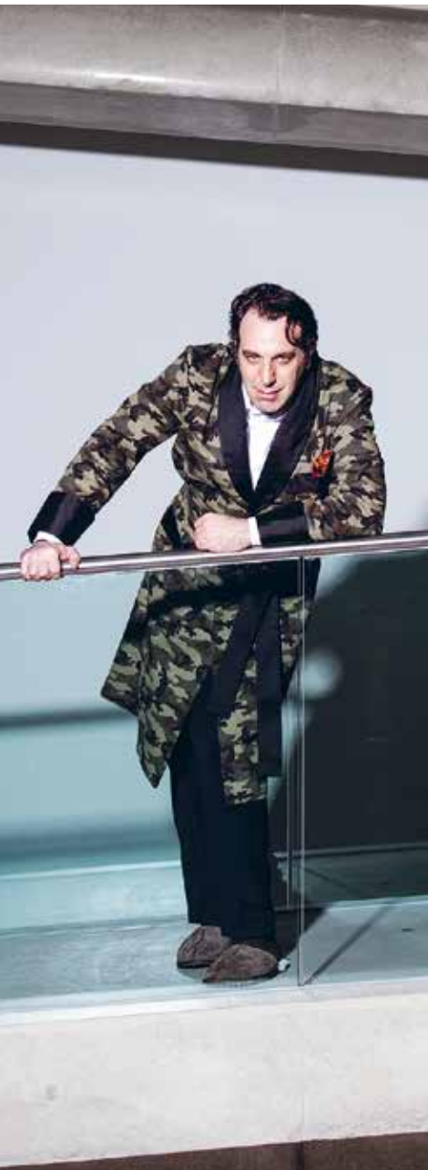
Chilly Gonzales