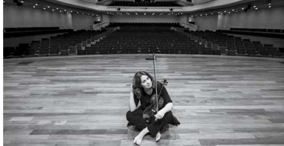
Patricia Kopatchinskaja

Découvrez un phénomène du violon ! D'origine moldave, Patricia Kopatchinskaja sidère par ses interprétations d'une incroyable liberté. Le lyrisme exacerbé du Concerto de Tchaïkovski sera particulièrement exalté par le caractère volcanique du jeu de la violoniste. Pour compléter ce programme, l'élégante Sinfonietta de Poulenc au rythme bondissant !