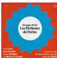
BIZET Alexandre Bloch ONL (Pentatone)

En vente sur place ou sur notre site, les derniers enregistrements de l'orchestre regroupent plusieurs opus salués par la critique.