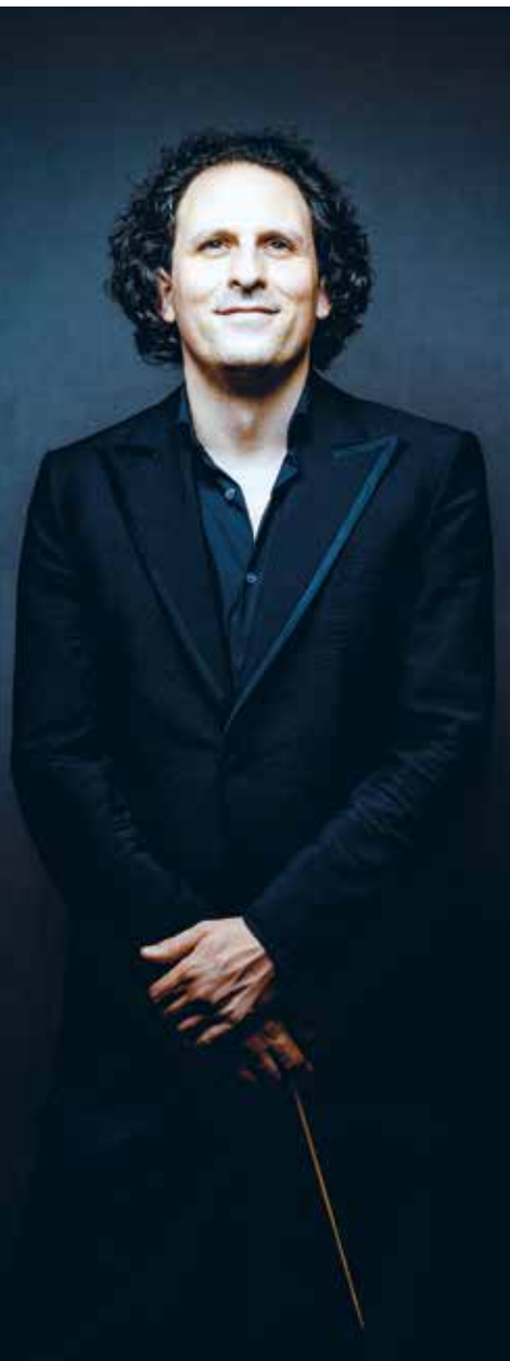
Alexandre Bloch

Face à l'incertitude actuelle, nous préférons d'ores et déjà vous proposer le concert « La joie de Poulenc » dans notre nouvelle salle de concert numérique : l'Audito 2.0.