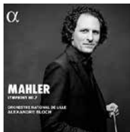
MAHLER Alexandre Bloch ONL (Alpha Classics)