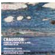
CHAUSSON Véronique Gens Alexandre Bloch ONL (Alpha Classics)