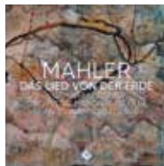
LE CHANT DE LA TERRE Jean-Claude Casadesu ONL (Evidence Classic)

Sur onlille.com • par téléphone au 03 20 12 82 40 (du lundi au vendredi de 10h à 13h, de 14h à 17h30) • sur place : 3, place Mendès France, Lille (du lundi au vendredi de 10h à 18h sans interruption)