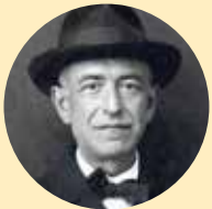
Manuel de Falla