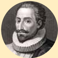
Miguel de Cervantes